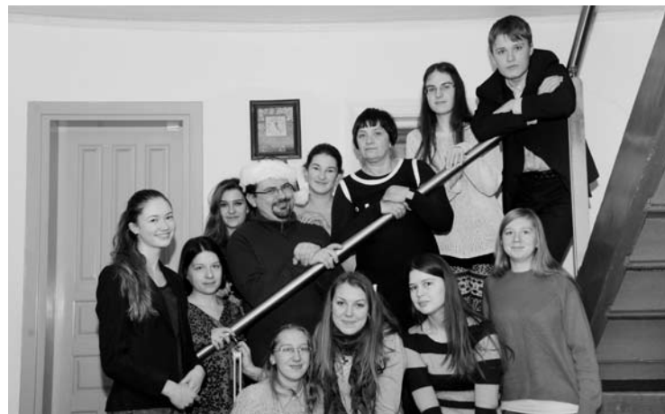
Jaunųjų žurnalistų mokyklėlė prie „Anykštos“ redakcijos veikia jau trečius metus. Baigę ją, moksleiviai gauna pažymėjimus. Nuotraukoje – 2015 m. laida.